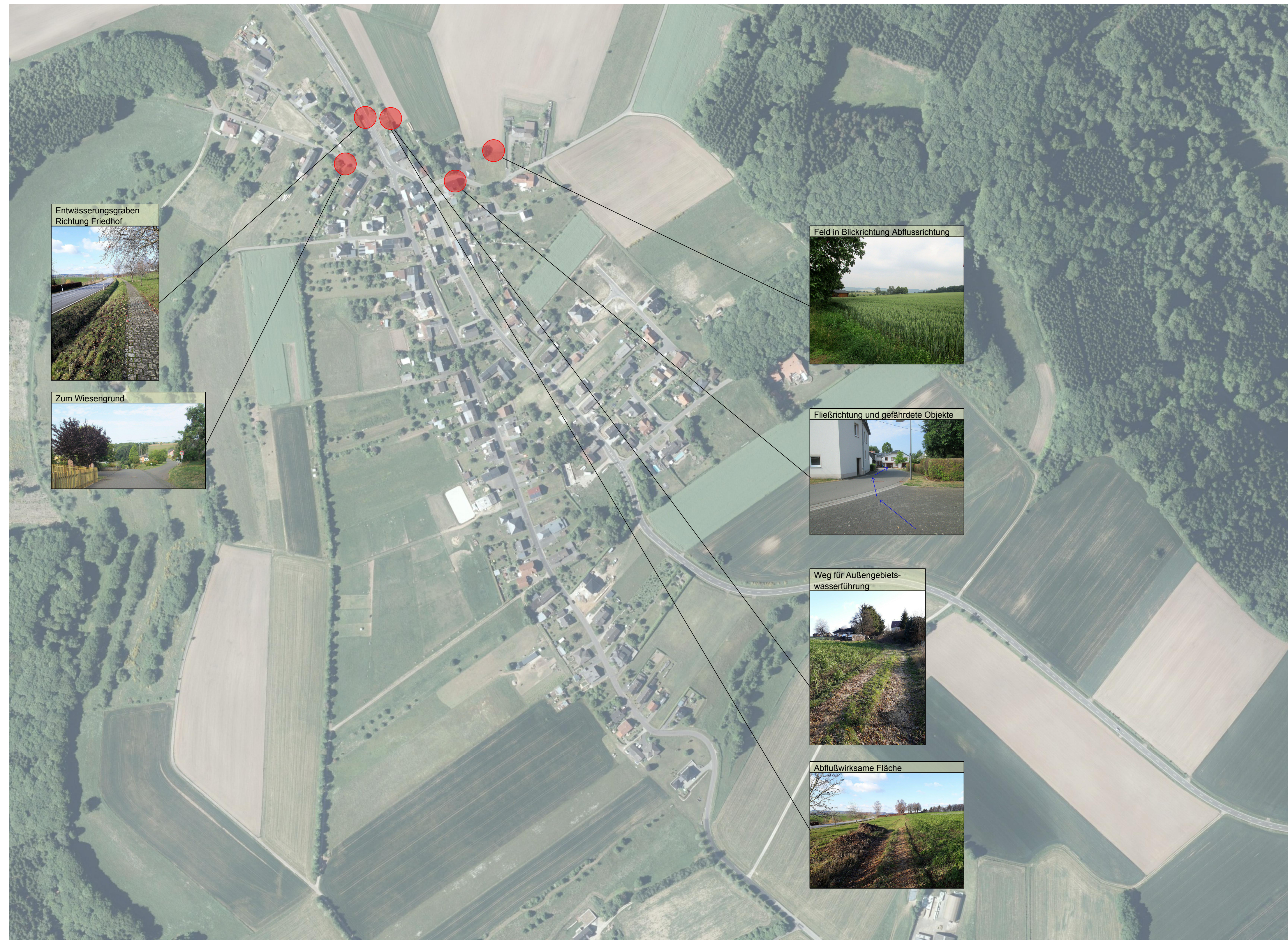
Entwässerungsgraben Richtung Friedhof